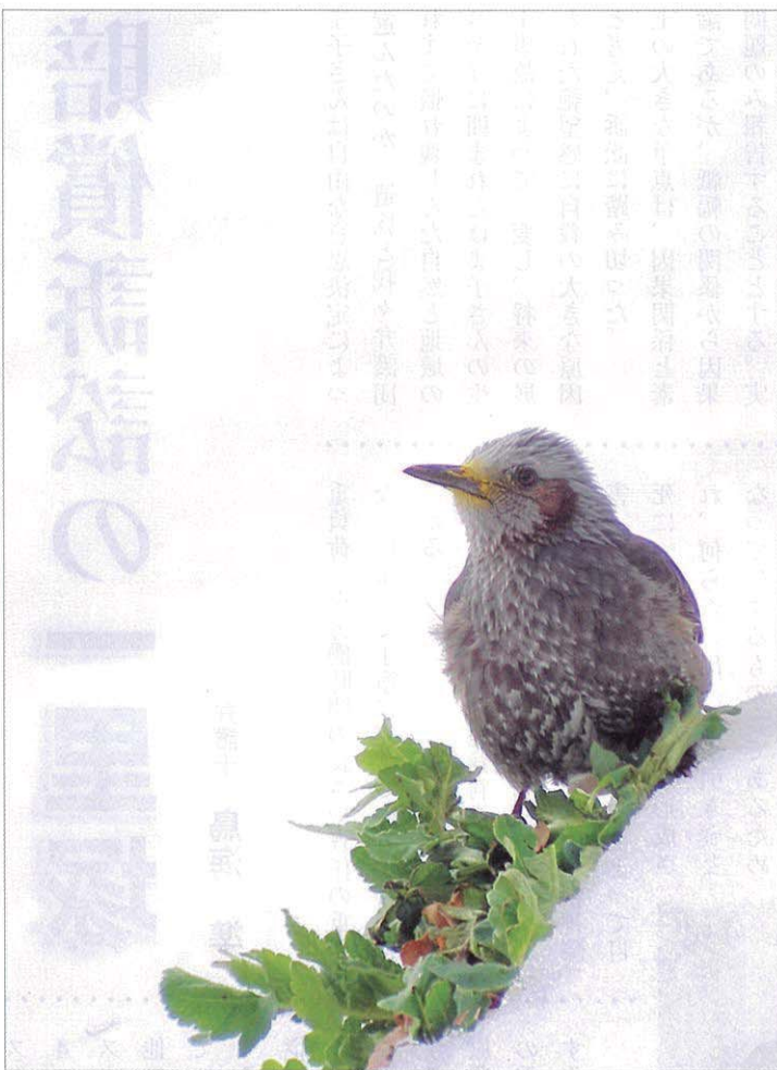
昨年(2014)の2月、稀に見る大雪に、いつもは喧嘩ばかりのヒヨドリもどこかしおらしい。国営昭和記念公園にて。

昨年の最大の出来事と言えば、安倍内閣が閣議決定で集団的自衛権の行使を可能にしたことでしょう。第二次世界大戦では自国他国の多くの命が奪われました。日本は、その反省の下に、70年近く平和憲法を遵守し、自国が武力攻撃された場合だけ必要最小限度の武力行使を認めるといって専守防衛を守ってきました。ところが、安倍内閣は、日本が攻撃されてもいらないのに、海外で武力行使できる道を開いたのです。これは、閣議決定という行政の意志で最高の規範である憲法を覆すということでもない暴挙です。 武力では紛争は解決しない、限らない報復の連鎖しか生まれないという事実が、昨今の米国、中近東、アフリカの諸事情を見ているとつくづく実感するところで